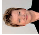
Sylvia Löhrmann Ministerin für Schule und Weiterbildung des Landes NRW

„Für die Heimat-Touren NRW bieten sich viele Museen, Ausstellungen, Naturschutzzentren und Biologische Stationen als interessante Ausflugsziele für den außerschulischen Unterricht an. Es ist erfreulich, dass die NRW-Stiftung einen weiteren Anreiz bietet und die Fahrtkosten für Schulklassen übernimmt – so lohnt sich ein Besuch gleich doppelt.“